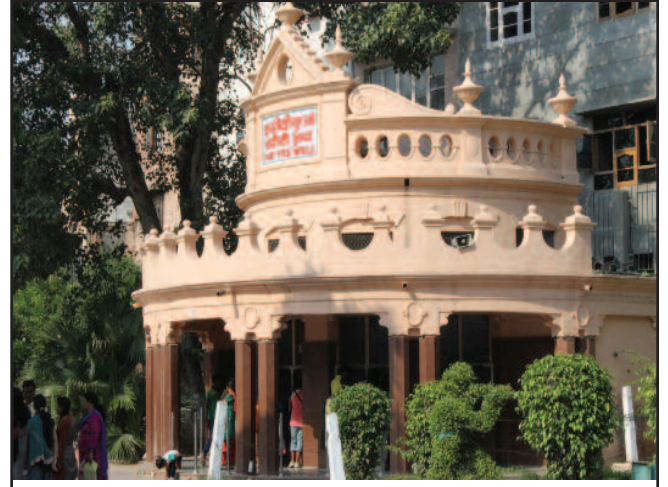
ਸ਼ਹੀਦੀ ਖੂਹ, ਜੋ ਉਸ ਵਕਤ ਲਾਸ਼ਾਂ ਨਾਲ ਭਰ ਗਿਆ ਸੀ