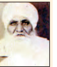
Baba Mani Singh Baba Lakh Shah Bhai Bachittar Singh Ji Bhai Diala Ji Baba Gurditta Ji Baba Sukhchain Singh Ji Baba Nand Singh Ji Baba Darshan Singh Ji Masat