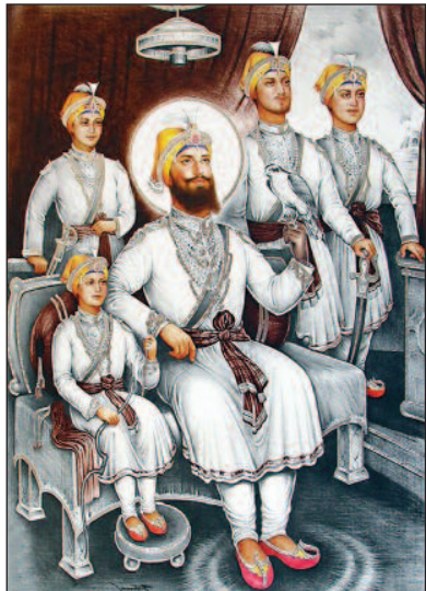
ਸਾਹਿਬਜ਼ਾਦਿਆਂ ਦੇ ਸ਼ਹੀਦੀ-ਪੁਰਬ 'ਤੇ ਵਿਸ਼ੇਸ਼ ਲੇਖ ਸਫਾ 11 ਤੇ ਦੇਖੋ

“ਕਾਮਾਗਾਟਾ ਮਾਰੂ ਸਫ਼ਰ ਜਾਰੀ ਹੈ” ਨਾਟਕ ਦੀ ਪੇਸ਼ਕਾਰੀ ਨੇ ਦਰਸ਼ਕਾਂ ਨੂੰ ਕੀਲ ਕੇ ਬਿਠਾਈ ਰੱਖਿਆ