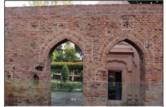
ਕੰਧਾਂ ਤੇ ਪਏ ਗੋਲੀਆਂ ਦੇ ਨਿਸ਼ਾਨ