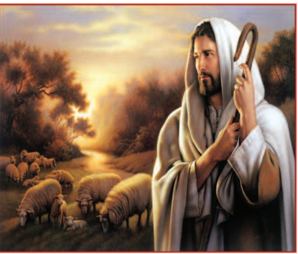
ਪੁੱਤਰ ਕਹਿਲਾਏਗਾ। ਪ੍ਰਭੂ ਯਿਸੂ ਨੇ ਆਪਣੇ ਜੀਵਨ ਕਾਲ ਵਿਚ ਇਸ ਧਰਤੀ 'ਤੇ ਅਨੇਕਾਂ ਚਮਤਕਾਰ ਕੀਤੇ, ਲੋਕਾਂ ਨੂੰ ਸ਼ਾਂਤੀ ਦਾ ਸੰਦੇਸ਼ ਦਿੱਤਾ ਅਤੇ ਪਿਆਰ ਅਤੇ ਭਾਈਚਾਰੇ 'ਤੇ ਜ਼ੋਰ

ਸੰਤ ਯੂਸਫ ਜਿਸ ਨਾਲ ਮਾਤਾ ਮਰੀਅਮ ਦੀ ਮੰਗਣੀ ਹੋਈ ਸੀ, ਉਸ ਨੂੰ ਵੀ ਪ੍ਰਮੇਸ਼ਵਰ ਦੇ ਦੂਤ ਨੇ ਆਖਿਆ ਕਿ ਹੇ ਯੂਸਫ ਤੂੰ ਮਰੀਅਮ ਨੂੰ ਆਪਣੀ ਪਤਨੀ ਬਣਾਉਣ ਤੋਂ ਨਾ ਡਰ, ਕਿਉਂ ਜੋ ਉਸ ਦੀ ਕੁੱਖ ਤੋਂ ਇਕ ਪਵਿੱਤਰ ਆਤਮਾ ਜਨਮ ਲਵੇਗੀ, ਤੂੰ ਉਸ ਦਾ ਨਾਮ ਯਿਸੂ ਰੱਖਣਾ ਕਿਉਂਕਿ ਉਹ ਆਪਣੇ ਲੋਕਾਂ ਨੂੰ ਉਹਨਾਂ ਦੇ ਪਾਪਾਂ ਤੋਂ ਬਚਾਏਗਾ। ਇਹ ਸਭ ਇਸ ਲਈ ਹੋਇਆ ਕਿ ਹਜ਼ਾਰਾਂ ਸਾਲ ਪਹਿਲਾਂ ਨਬੀਆਂ ਦੁਆਰਾ ਕਿਹਾ ਗਿਆ ਇਹ ਵਾਕ ਪੂਰਾ ਹੋਇਆ। ਇਕ ਕੁਆਰੀ ਗਰਭਵਤੀ ਹੋਵੇਗੀ ਅਤੇ ਪੁੱਤਰ ਨੂੰ ਜਨਮ ਦੇਵੇਗੀ। ਉਹ ਪ੍ਰਮ ਪ੍ਰਧਾਨ ਦਾ