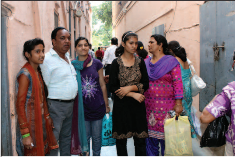
ਇਹ ਉਹ ਗਲੀ ਹੈ ਜੋ ਇਕੋ ਇਕ ਬਾਗ ਵਿਚ ਜਾਣ ਦਾ ਰਸਤਾ ਹੈ।