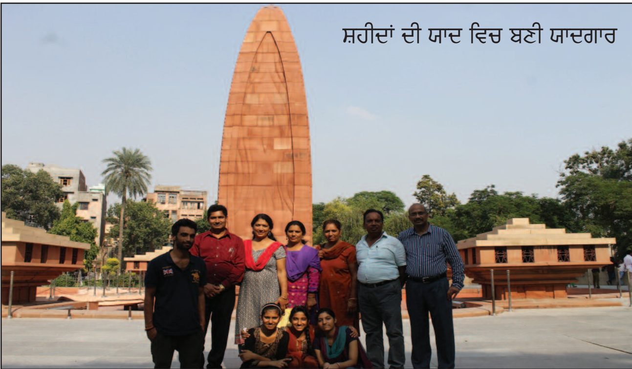
ਸ਼ਹੀਦਾਂ ਦੀ ਯਾਦ ਵਿਚ ਬਣੀ ਯਾਦਗਾਰ

ਕੰਪਨੀਆਂ ਵਿਚ ਕੰਮ ਵੀ ਕੀਤਾ। ਨਿਉਯਾਰਕ ਤੋਂ ਉਹਨਾਂ ਨੇ ਸਮੁੰਦਰੀ ਜਹਾਜ਼ ਰਾਹੀਂ ਯੂਰਪ ਦੇ ਕਈ ਦੇਸ਼ਾਂ ਦਾ ਸਫ਼ਰ ਵੀ ਕੀਤਾ। ਸਭ ਤੋਂ ਪਹਿਲਾਂ ਉਹ ਫਰਾਂਸ ਪਹੁੰਚੇ। ਉਸ ਤੋਂ ਬਾਅਦ ਬੈਲਜੀਅਮ, ਜਰਮਨੀ, ਲਾਤੂਨੀਆਂ ਦੇ ਵਿਲਨਾਂ ਤੇ ਵਾਪਸੀ ਹੰਗਰੀ, ਪੋਲੈਂਡ, ਸਵਿਟਜ਼ਰਲੈਂਡ, ਇਟਲੀ ਤੇ ਫਿਰ ਫਰਾਂਸ ਤੋਂ ਵਾਪਸ ਅਮਰੀਕਾ ਆ ਗਏ। ਇਸ ਪਿੱਛੋਂ ਥੋੜ੍ਹੇ ਮਹੀਨੇ ਅਮਰੀਕਾ ਵਿਚ ਰਹਿ ਕੇ ਫਿਰ ਸਮੁੰਦਰੀ ਜਹਾਜ਼ਾਂ ਵਿਚ ਕਈ ਮੈਡੀਟੇਰੀਅਨ ਬੰਦਰਗਾਹਾਂ 'ਤੇ ਇਕ ਤਰਖਾਣ (ਕਾਰਪੈਂਟਰ) ਦੇ ਤੌਰ 'ਤੇ ਨੌਕਰੀ ਕੀਤੀ ਤੇ ਅਖੀਰ ਇਕ ਪੌਤ ਰਾਹੀਂ ਉਹ ਕਰਾਚੀ ਪਹੁੰਚ ਗਏ। ਉਥੋਂ ਹੁੰਦੇ ਹੋਏ 1927 ਵਿਚ ਕਲਕੱਤਾ ਪਹੁੰਚ ਗਏ। ਅਮਰੀਕਾ ਰਹਿੰਦੇ ਸਮੇਂ ਉਹ ਗਦਰ ਪਾਰਟੀ ਦਾ ਕ੍ਰਾਂਤੀਕਾਰੀ ਸਾਹਿਤ ਪੜ੍ਹ ਕੇ ਜੋ 'ਗਦਰ' ਅਖਬਾਰ ਵਿਚ ਛਪਦਾ ਸੀ ਤੋਂ ਬਹੁਤ ਪ੍ਰਭਾਵਿਤ ਹੋਏ। 27 ਜੁਲਾਈ, 1927 ਨੂੰ ਉਹਨਾਂ ਨੂੰ ਗਦਰੀ ਸਾਹਿਤ ਤੇ ਇਤਰਾਜ਼ਯੋਗ ਪੋਸਟ ਕਾਰਡ ਕੋਲ ਰੱਖਣ ਕਰਕੇ ਜੁਰਮਾਨਾ ਵੀ ਕੀਤਾ ਗਿਆ।