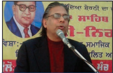
ਭੀਮ ਰਾਏ ਅੰਬੇਡਕਰ ਦਾ ਪ੍ਰੀਨਿਰਮਾਣ ਦਿਵਸ ਮਨਾਇਆ ਗਿਆ- ਦੇਖੋ ਸਫਾ 7 ਤੇ

ਸੰਨ 1914 ਵਿਚ ਜਦ ਕਾਮਾਗਾਟਾ ਮਾਰੂ ਦੀ ਘਟਨਾ ਵਾਪਰੀ ਉਸ ਵੇਲੇ ਗ਼ਦਰ ਲਹਿਰ ਪੂਰੇ ਜ਼ੋਰ ਤੇ ਸੀ। ਭਾਰਤੀ ਵਪਾਰੀ ਬਾਬਾ ਗੁਰਦਿੱਤ ਸਿੰਘ ਨੇ ਹਾਂਗਕਾਂਗ ਤੋਂ ਇੱਕ ਨਾਮੀ ਜਹਾਜ਼ ਜਪਾਨੀ ਕੰਪਨੀ ਕਾਮਾਗਾਟਾ ਮਾਰੂ ਤੋਂ ਜਹਾਜ਼ ਕਿਰਾਏ ਤੇ ਲਿਆ ਸੀ। ਕਨੇਡਾ ਜਾਣ ਦੇ ਚਾਹਵਾਨ ਪੰਜਾਬੀ ਭਾਰਤੀ ਤੇ ਹੋਰ ਲੋਕਾਂ ਨੂੰ ਲੈਕੇ ਜਾਣ ਲਈ (ਕਨੇਡਾ ਸਰਕਾਰ ਦੇ ਭਾਰਤੀ ਏਜੰਸੀਆਈ ਲੋਕਾਂ ਪ੍ਰਤੀ ਵਿਤਕਰੇ ਦੀ ਭਾਵਨਾ ਵਾਲਾ ਕਾਨੂੰਨ ਬੋਧਣ ਦੇ ਬਾਵਜੂਦ 200 ਡਾਲਰ ਜੇਬ ਵਿਚ ਹੋਣ ਦੀ ਸ਼ਰਤ ਮਨਜ਼ੂਰ ਕਰਦੇ ਹੋਏ ਵੀ) ਤਿਆਰੀ ਕਰ ਲਈ ਅਤੇ 400 ਯਾਤਰੀਆਂ ਨੂੰ ਲੈ ਕੇ ਆਪਣੀ ਮੰਜ਼ਿਲ ਵੱਲ ਚੱਲ ਪਏ। ਲੰਬੇ ਸਮੇਂ ਦੀ ਖੱਲ ਖਰਾਬੀ ਤੋਂ ਬਾਅਦ ਇਨ੍ਹਾਂ ਨੂੰ ਵਿਤਕਰੇ ਦਾ ਸ਼ਿਕਾਰ ਹੋ ਕੇ ਵਾਪਸ ਮੁੜਨਾ ਪਿਆ। ਵਾਪਸੀ ਤੋਂ ਬਾਬਾ ਸੋਹਣ ਸਿੰਘ ਭਕਨਾ ਅਤੇ ਕਰਤਾਰ ਸਿੰਘ ਸਰਾਭਾ ਦੇ ਸੰਪਰਕ ਵਿਚ ਆ ਕੇ ਇਹ ਯਾਤਰੀ ਵੀ ਅਖੀਰ ਭਾਰਤ ਦੀ ਅਜ਼ਾਦੀ ਦੇ ਘੋਲ ਦੇ ਵਿਚ ਸ਼ਾਮਲ ਹੋ ਗਏ ਸਨ। ਅਖੀਰ ਬਜ ਬਜ ਘਾਟ ਕਲਕੱਤਾ ਵਿਖੇ ਬ੍ਰਿਟਿਸ਼ ਸਰਕਾਰ ਨੇ (ਬਾਕੀ ਖਬਰ ਸਫਾ 4 ਤੇ ਦੇਖੋ)